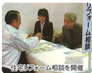
住宅リフォーム相談を開催