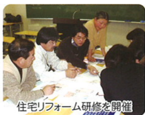
住宅リフォーム研修を開催