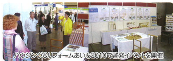
ハウジング&リフォームあいち2010で啓発イベントを開催